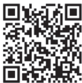
▲祖師公暗訪邊境影片