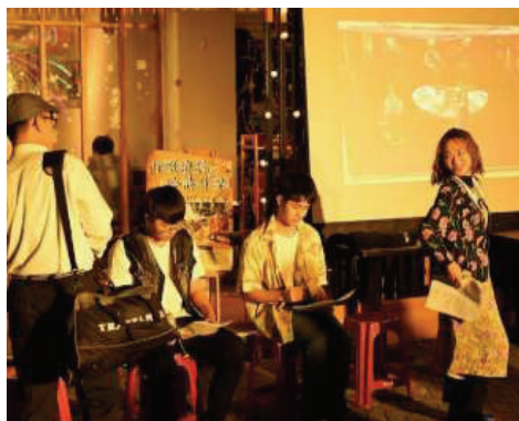
▲「淡水田野劇場」於南小軒咖啡館前演出學生劇作2(2024.1)