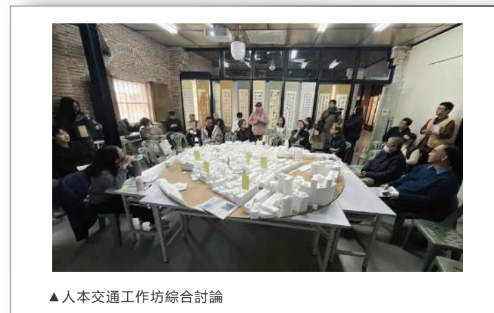
▲人本交通工作坊綜合討論