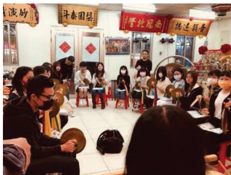
▲「大學生北管學堂」至淡水南北軒學習北管(2021.4)