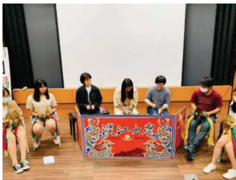
▲「大學生北管學堂」學生練習北管(2021.5)