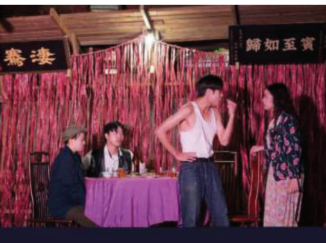
▲「淡水田野劇場」於2024淡水生活節再次演出(2024.11)