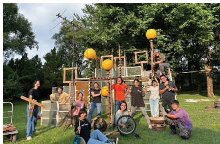
▲創樂子生活學苑與社區居民運用廢棄物共創「共創雲山海之聲」