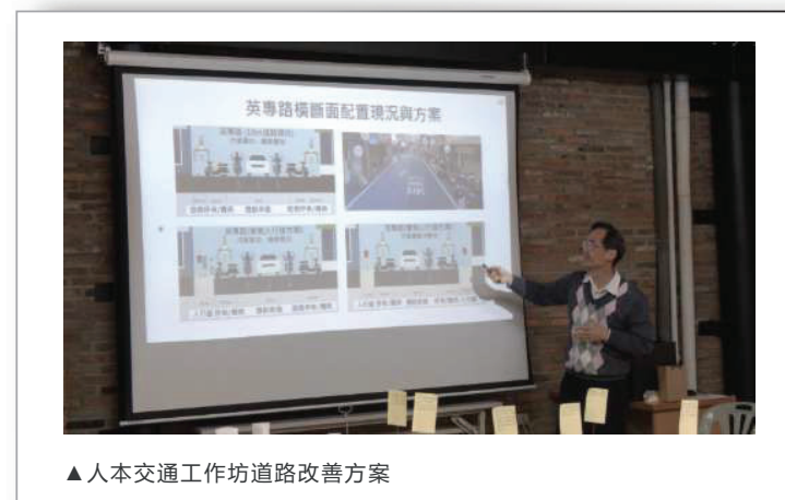
▲人本交通工作坊道路改善方案