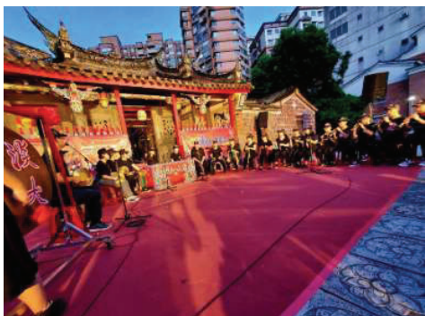
▲「大學生北管學堂」在淡水鄞山寺廟口演出(2020.6)