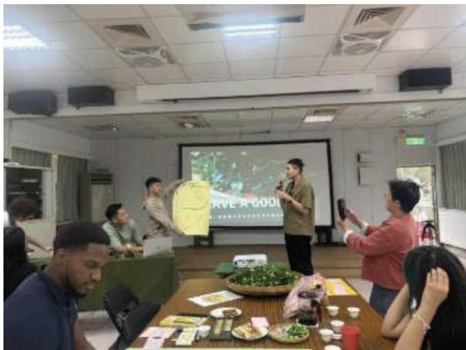
▲授課教師結合本地與國際學生，與社區及產業夥伴進行跨文化共創實踐，透過行動導向的合作模式，促進知識共享與永續夥伴關係的建立