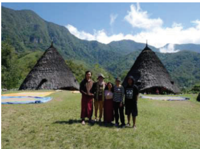
▲學生透過跨國合作與行動成果發表，將在地經驗連結國際視角，擴散專業資源與社會影響力，展現高等教育回應永續發展與社會責任的實踐成果