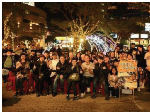
▲「淡水田野劇場」於南小軒咖啡館前作呈現(2024.1)