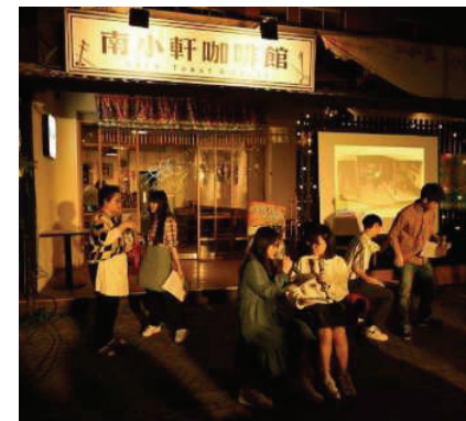
▲「淡水田野劇場」於南小軒咖啡館前演出學生劇作(2024.1)