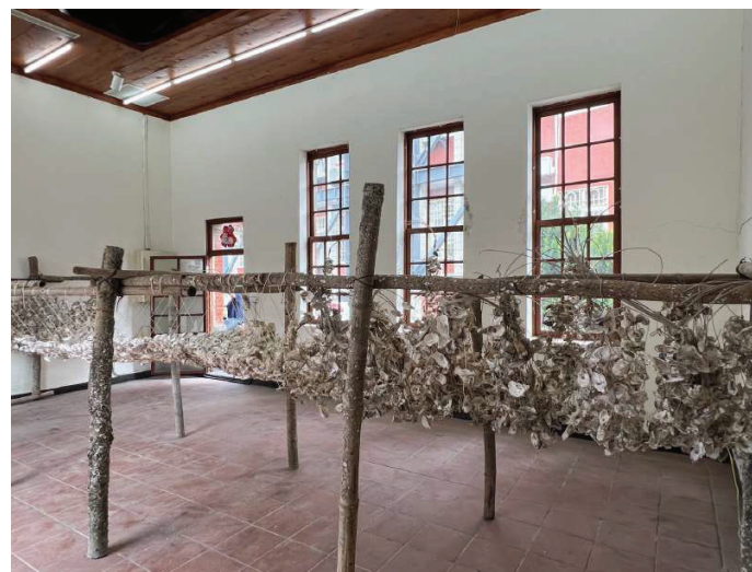
▲日本藝術家杉原信幸以海廢與蚵殼完成藝術共創作品「串吊蚵的光集」