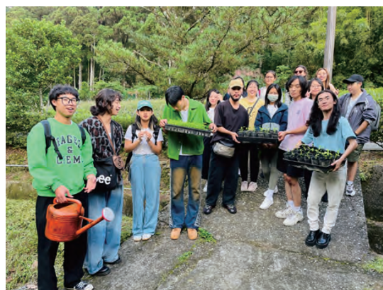
▲探究林地、臺灣木材自主率與碳匯 (「森林療癒引導」課程)