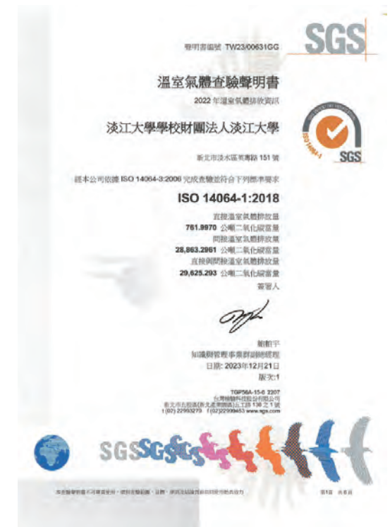
▲查驗聲明書-中文版

此外，因應全球氣候變遷及呼應政府訂定之「2050年淨零排放」目標，本校推動永續發展課題，由教師帶領學生共同參與能源使用現況盤點、再生能源發展潛力、減碳實施策略與效益評估等校務發展重點工作。本校業已宣示「建校100年、淨零校園」之推動方向。故在2023年已通過ISO 14064-1:2018 溫室氣體盤查外部查驗。因2022年首次進行大規模盤查計畫執行年度，且取得外部查證，故將2022年設為基準年，後續則持續遵循ISO 14064-1:2018原則，落實自我管理與資訊揭露。