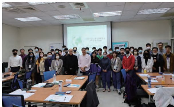
▲學生參與溫室氣體盤查課程