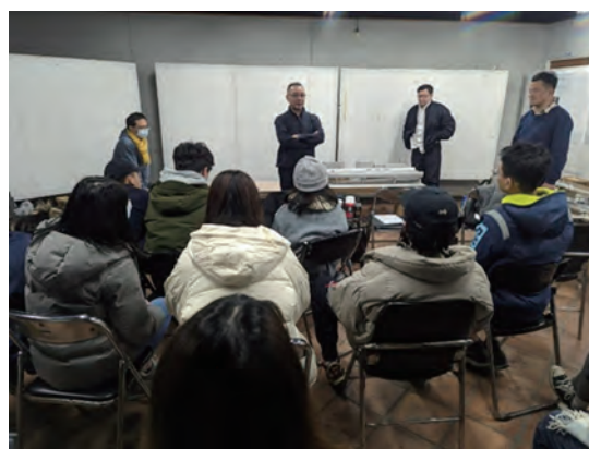
▲講師針對學生作品進行總結 (「設計發展建構--透視圖微課程」課程)