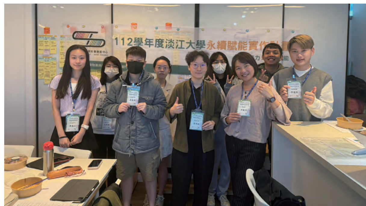
▲ 永續賦能實作大使與指導老師及永續教練合照

徵選期間，永續中心於2023年10月14日舉辦一日永續賦能實作培力工作坊。截至112年12月31日，永續賦能實作行動已召開七次工作會議，每次會議在發布任務的同時也逐步修正團隊模式，而每位永續大使也有專屬於自己的賦能實作紀錄，內含個人所參與到的任務及心得，預計將於2024年4月舉辦發表會，讓這些累積而來的實作經歷成為日後職涯的助力。