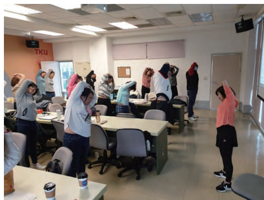
▲演講課程進行中配合音樂教學示範 (「健康事業行銷管理學」課程)

永續中心亦積極給予教師在課程融入USR議題的獎勵，透過高等教育深耕計畫經費提供獎勵，112年度共有7位教師、9堂課程獲得此獎勵(包含文學院教師1名、工學院教師1名、商管學院教師2名、國際學院教師1名、教育學院教師1名及精準健康學院1名)，每堂課獎勵金額新臺幣2,000至8,000元不等。